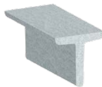
Aciers en „T“