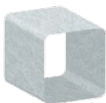
Tubes carrés et rectangulaires

20 x 20 x 2 - 100 x 100 x 5 / 30 x 20 x 2 - 140 x 80 x 4