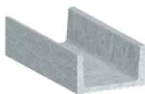
Aciers en „U“