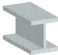
Formstahl und Breitflanschträger